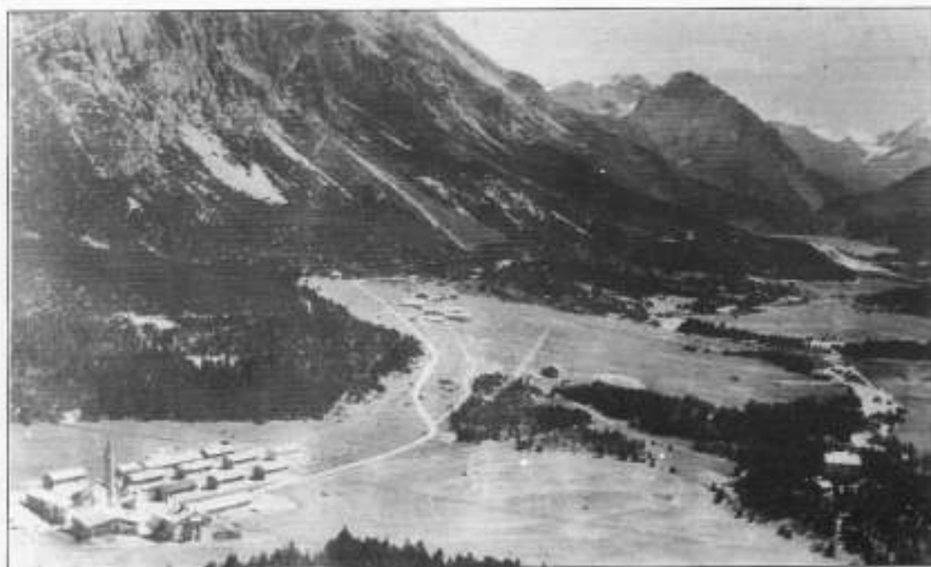
Sotto: La Valle di San Giacomo prima dell'invaso