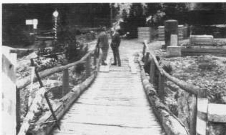
A fianco: Il vecchio ponte del Gallo