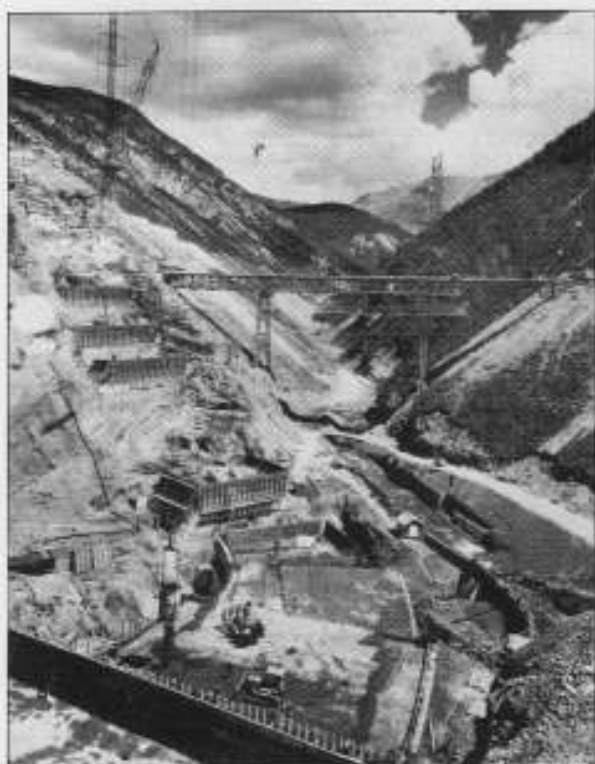
Inizio costruzione diga