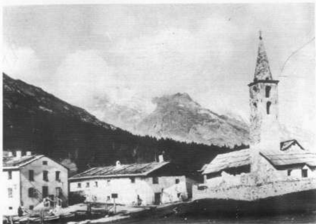
L'abitato di S. Giacomo di Fraele