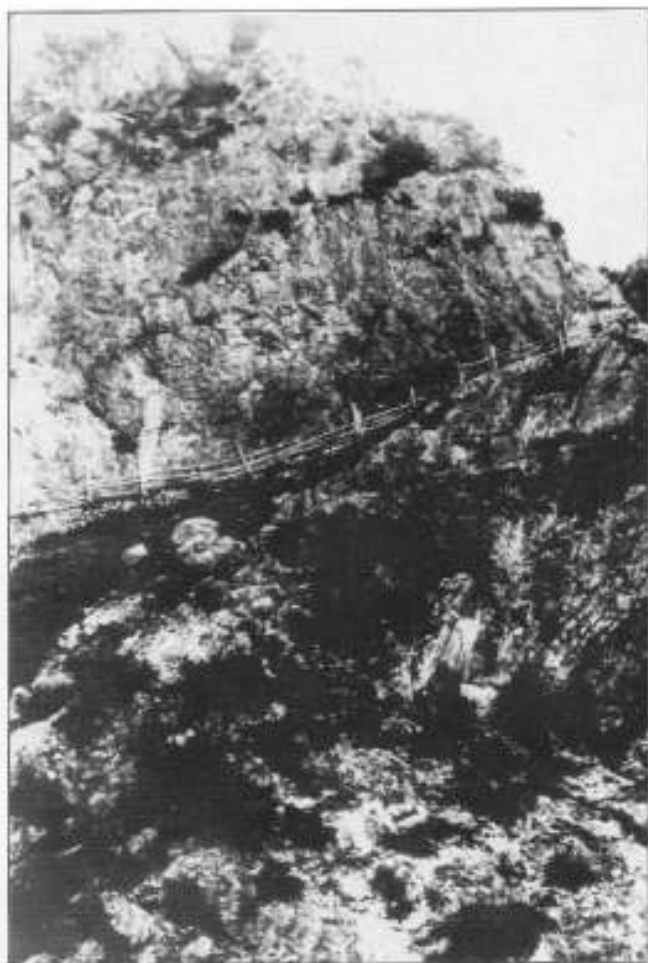
A fianco: Le scale di Fraele